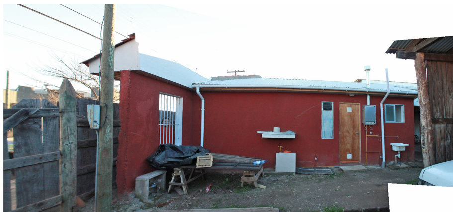
Figura 2. Vista exterior de prototipos de viviendas de "fachada continua" en el barrio de Yungay de Cauquenes. Fuente: Realización propia. En colaboración con Laura Carreño y Rosa Estrada.

Por otro lado, la vivienda resultado del Plan de Reconstrucción, en muchas ocasiones, presenta carencias en su concepción y materialización. Por una parte, deficiencias a nivel de proyecto en cuanto a la calidad espacial interior, exterior y de los espacios colectivos y por otra, problemas con respecto a la calidad de los materiales, las soluciones constructivas escogidas, la ejecución y el incumplimiento de plazos, etc. Destacaríamos casos como los prototipos propuestos para el barrio Yungay en la ciudad de Cauquenes, Figura 2 y 3.