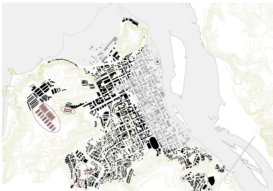
Figura 4. Planimetría de Constitución. 1. Afectación Terremoto-Tsunami 2010. 2. Aldeas y Asentamientos 2013.

con subsidios 50% trabajadores de la empresa de maderera “Arauco”. Viviendas unifamiliares algunas con plan de ampliación, otras no. Descripción : Llevan meses retrasando la entrega de las viviendas. Obras no quiere recepcionar por problemas de desnivelación. En vivienda social lo máximo que se puede construir son 52m 2 con posibilidad de ampliación hasta 57m 2 .