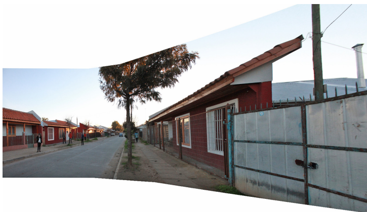
Figura 3. Vista interior de prototipo de vivienda de "fachada continua" en el barrio de Yungay de Cauquenes.

El valor patrimonial de las tradicionales casas de adobe del barrio Yungay, así como las relaciones urbanas e interiores que se producían en las mismas, por ejemplo en las galerías interiores de parrales, quedan reducidas a prototipos que escenifican una calle con edificación de una planta adosada, y para ello se utilizan prototipos