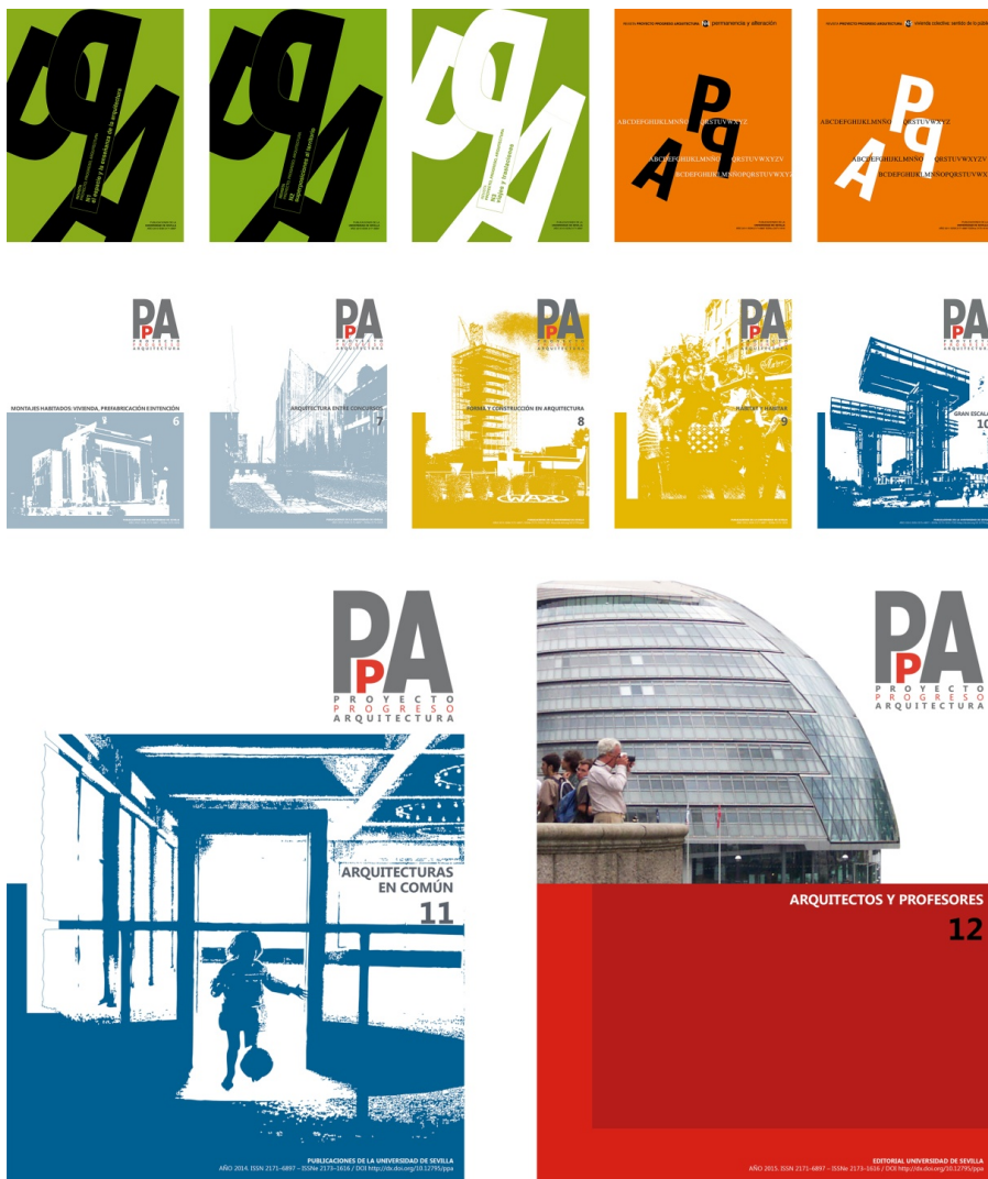
Portadas de la revista indexada «Proyecto, progreso, arquitectura». Números 1 a 12. Producción con indicios de calidad de los años 2010 a 2015.

2012, noviembre. Se publica PpA-7. “Arquitectura entre concursos”. Editorial de Francisco Javier Montero: “Arquitecturas invisibles”.