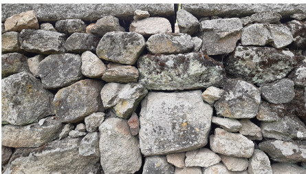
Aparejos de siete y medio muros antiguos que dialogaban con el MACNA en agosto de 2019