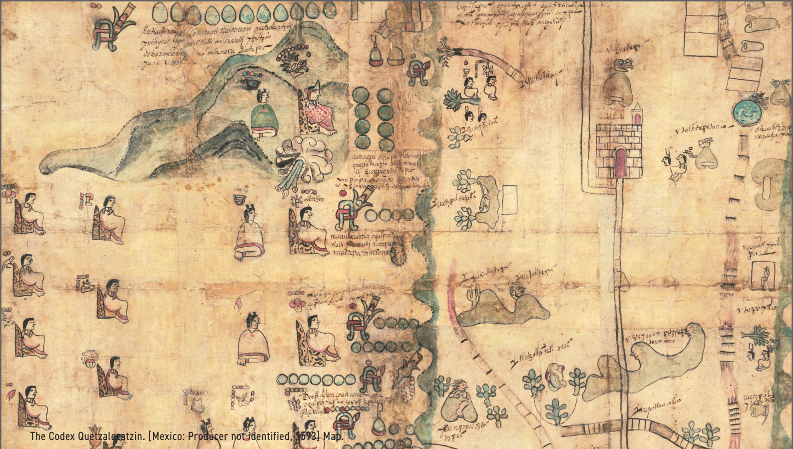
The Codex Quetzalcóatl. [Mexico: Producer not identified, 1693] Map.